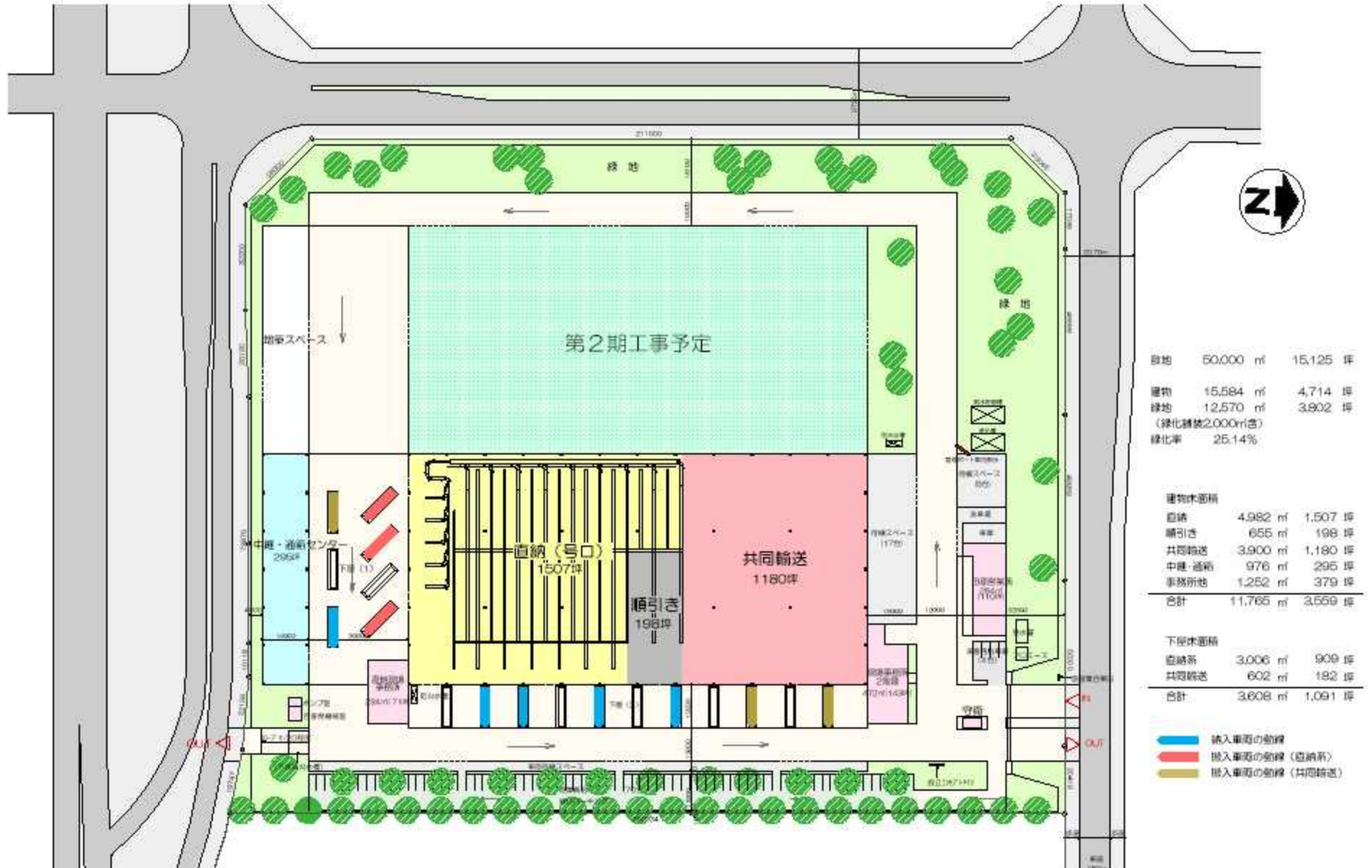
翔運輸株式会社 田原物流センター 配置・平面図